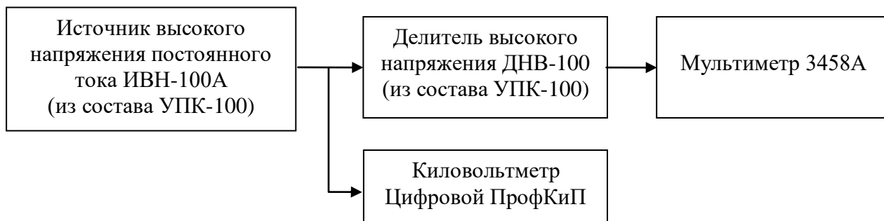
Рисунок 2 – Структурная схема подключения приборов для определения относительной погрешности измерения напряжения постоянного тока

– с помощью источника высокого напряжения ИВН-100А по мультиметру 3458А последовательно устанавливают значения напряжения постоянного тока, соответствующие: 2 кВ, 5 кВ, 10 кВ, 15 кВ, 20 кВ, 30 кВ, 40 кВ, 50 кВ, 60 кВ, 70 кВ, 80 кВ, 90 кВ, 100 кВ ;