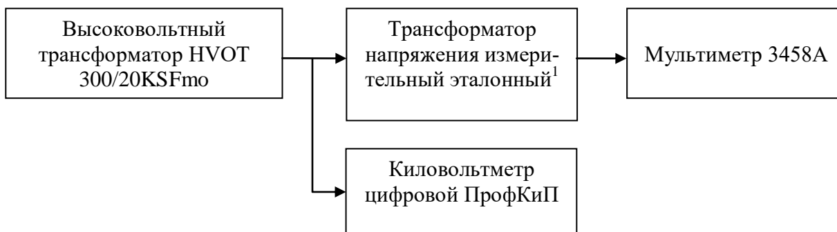
Рисунок 1 – Структурная схема подключения приборов для определения относительной погрешности измерения среднеквадратических значений напряжения переменного тока синусоидальной формы частотой 50 Гц.

Примечание 1 – при измерении напряжения переменного тока частотой 50 Гц до 40 кВ (включительно) используют трансформатор напряжения измерительный эталонный NVRD, при измерении напряжения переменного тока частотой 50 Гц свыше 40 кВ используют трансформатор напряжения измерительный NVOS.