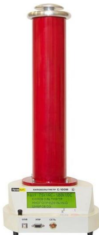
Рис 1. Внешний вид киловольтметра «ПрофКиП С100М».

Внешний вид киловольтметра приведен на рис. 1.